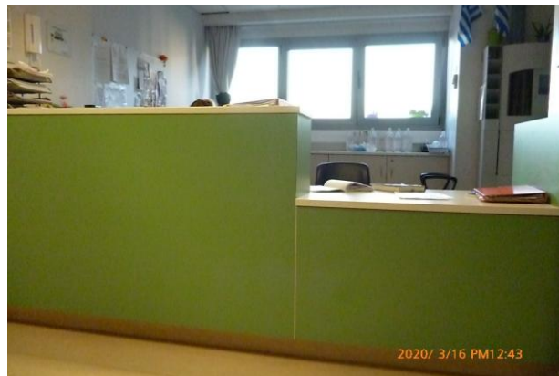
Εικόνα 1. Στάση Νοσηλευτικής Πολυώροφου Τμήματος του Κεντρικού Κτιρίου

Στην εικόνα 1 παρουσιάζεται ο πάγκος δύο επιπέδων των στάσεων όπου πρόκειται να γίνουν οι τοποθετήσεις.